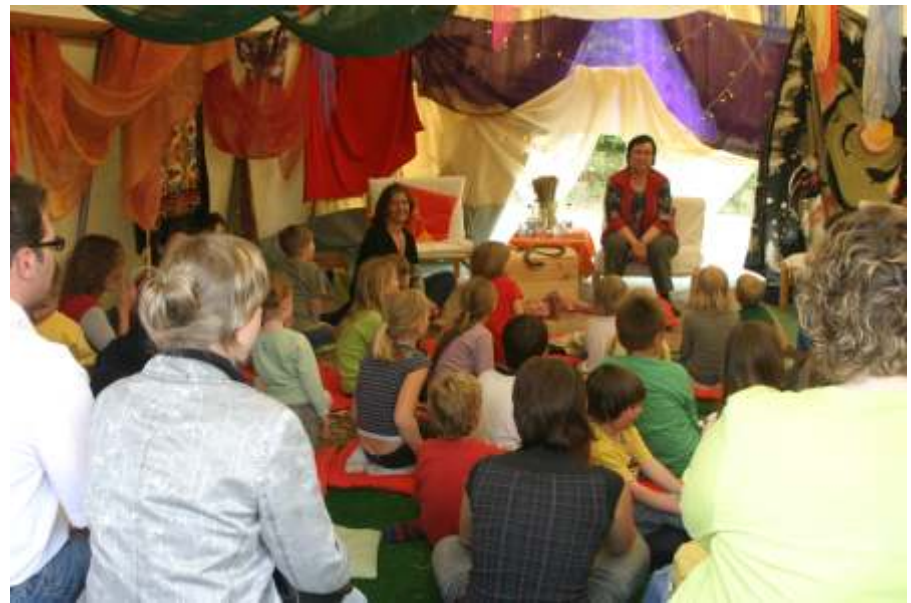
So wird das Erzählen einer Geschichte zum Erlebnis: Erzählfest im Kindergarten Buchau